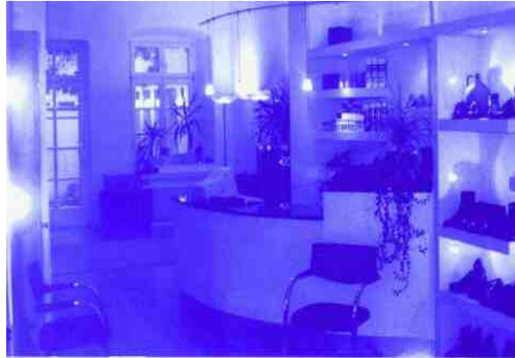
Hochwertige Schuhe im klassisch-modischen Bereich bill

Die Entscheidung fiel auf SDS fashion, eine Lösung des Weinheimer Softwarehauses Science Data Software. Die Ware wird zentral angeliefert, kontrolliert und ausgezeichnet. Dabei stellt ein kombiniertes Mehrfachidentsystem sicher, daß jede Art von Manipulation sicher erkannt und vom System abgewiesen und protokolliert wird. Die Ware wird in die Filialen geliefert, wo die Verkäufe an PC-Kassen erfaßt werden.